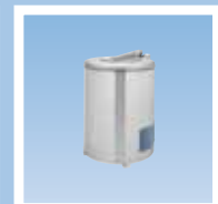
C240R-C260R-C290R Центрифуга, жесткое крепление