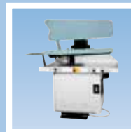
FPA3-D гладильный пресс