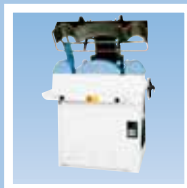
FPA6-WC манжетно-воротниковый пресс