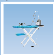
FIT1 гладильный стол