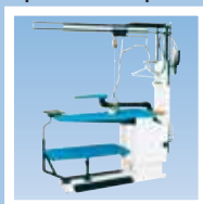
FIT6A гладильный стол