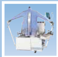
FSF рубашечный пароманекен