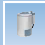
C240-C260 Центрифуга, свободное крепление