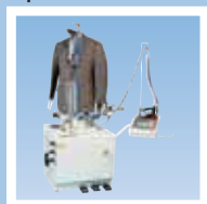
FFT-D пароманекен для верхней одежды