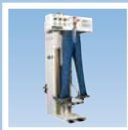
FTT1 брючный пароманекен