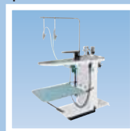
FSU1 пятновыводной стол

К Вашим услугам широкий выбор вспомогательного оборудования и аксессуаров (тележки, подставки, конденсаторы и пр.), обратитесь к представителям компании в Вашем регионе.